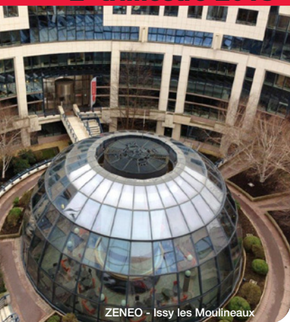
ZENEO - Issy les Moulineaux